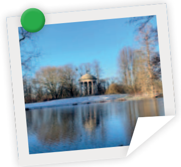
Die Wanderung ging vorbei am Leibniz Tempel.