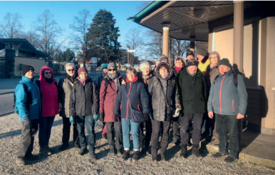
Kurzer Zwischenstopp vor dem Milchhäuschen an der Graft. Die Gesichter glänzen in der Sonne.